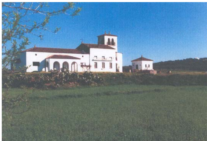
Estación de Ferrocarril de Villanueva del Fresno

Los trámites a seguir y la fórmula más adecuada para legalizar la sesión, sería obra exclusiva del Municipio con los propietarios.